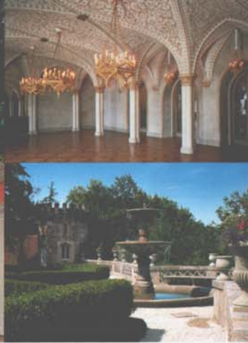
Landschaftspark mit Schwanensee (li. o.); Marmorsaal (re. o.); Salon des Herzogs (li. u.); Aussichtsterrasse (re. u.)