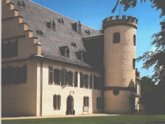
Das romantische Schloss Rosenau war Sommersitz der Coburger Herzöge.