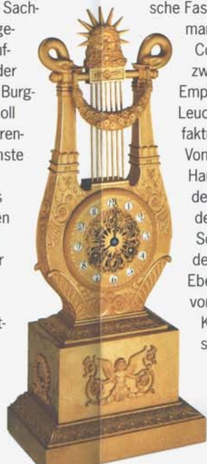
Pendule in Lyraform, Choiselat & Gallien zugeschrieben, Paris um 1815

Herzog Ernst I. (reg. 1806 bis 1844) ließ Schloss Ehrenburg wenige Jahre nach seinem Regierungsantritt dem Zeitgeschmack gemäß umge-